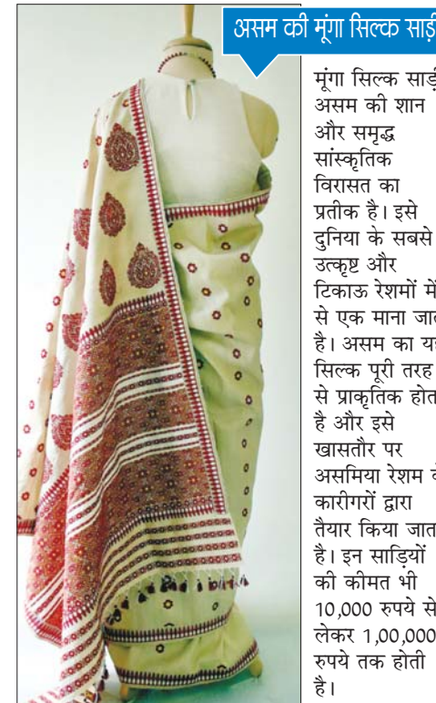
असम की मूंगा सिल्क साड़ी

गुजरात की यह साड़ियां डबल-इकट तकनीक से बनाई जाती हैं। यह साड़ी अपनी जटिल बुनाई, शानदार डिजाइन, और समृद्ध सांस्कृतिक महत्व के लिए प्रसिद्ध है। इसके खास काम की वजह से ही इसे तैयार होने में 6 महीने से एक साल तक का समय लग जाता है। आमतौर पर इसकी कीमत 2 लाख से 10 लाख तक होती है।