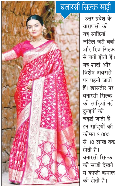
बनारसी सिल्क साड़ी

कांचीपुरम की ये साड़ियां मूलरूप से तमिलनाडु में बनाई जाती हैं और इन्हें असली सोने व चांदी की जरी का उपयोग होता है। इनकी गुणवत्ता और बुनाई कला इन्हें खास बनाती है। कीमत की बात करें तो कांचीपुरम सिल्क की कीमत साड़ी 1 लाख से 40 लाख रुपये तक की होती है। इसकी कीमत इसके जरी के काम पर निर्भर करती है।