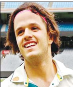
के पास काबिलियत है और उसे भविष्य में टेस्ट क्रिकेट में और

साउथवेल्स के लिए शेफील्ड शील्ड के दो मैचों में शतक जमाया। भारत ए के खिलाफ एमसीजी पर मैच में उन्होंने नाबाद 73 रन बनाए जबकि कैनबरा में भारत के खिलाफ प्रधानमंत्री एकादश के लिए गुलाबी गेंद के मैच में 107 रन की पारी खेली। ऑस्ट्रेलिया के मुख्य चयनकर्ता जॉर्ज बेली ने कहा सैम को पहली बार टेस्ट टीम में शामिल किया गया है। उसकी बल्लेबाजी की शैली अलग है। हमें विश्वास है कि नाथन