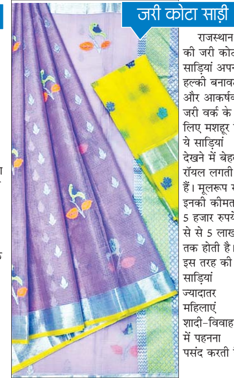
जरी कोटा साड़ी

मूंगा सिल्क साड़ी असम की शान और समृद्ध सांस्कृतिक विरासत का प्रतीक है। इसे दुनिया के सबसे टिकाऊ रेशमों में से एक माना जाता है। असम का यह सिल्क पूरी तरह से प्राकृतिक होता है और इसे खासतौर पर असमिया रेशम के कारीगरों द्वारा तैयार किया जाता है। इन साड़ियों की कीमत भी 10,000 रुपये से लेकर 1,00,000 रुपये तक होती है।