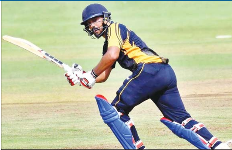
अफ्रीका के दिग्गज एबी डिविलियर्स 31 अपने पहले मैच में 165 रन के टारगेट को बॉल में से पीछे हैं। पंजाब ने टूर्नामेंट के केवल 12.5 ओवर में हासिल कर लिया।

अनमोलप्रीत का 35 गेंदों में शतक अब लिस्ट-ए इतिहास का तीसरा सबसे तेज शतक है। वे केवल ऑस्ट्रेलिया के जैक प्रेजर मैकगर्क 29 बॉल में और