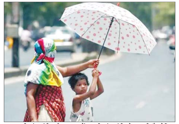
पर हल्की बूंदबांदी हुई। जानकारों की बूंदबांदी हो सकती है लेकिन का कहना है कि आजकल में राहत इसके बाद उमस बेहाल कर देगी।

जबलपुर (स्वतंत्र मत)। 7 मई मंगलवार का दिन इस सीजन का सबसे गर्म दिन दर्ज किया गया इस दिन का अधिकतम तापमान 42.1 दर्ज किया गया। इसका असर सुबह से ही महसूस कया जाता रहा। दिन भर चटक धूप और गर्म हवाओं के थपेड़ों ने आमजन को बेहाल कर दिया था। देर शाम उत्तर पश्चिमी हवायें करीब 4 किमी की रफतार से चलीं जिस कारण थोड़ी राहत महसूस की गई, कुछ स्थानों