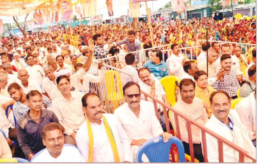
हिन्दुओं से वोट मांगने का नैतिक अधिकार : मोहन यादव

प्रधानमंत्री डॉ.मनमोहन सिंह गांधी परिवार के दबाव में तुष्टीकरण में व्यस्त रहते हुए समाज विशेष को खुश करने का कार्य करते थे। वे कहते थे देश की सम्पत्ति पर पहला अधिकार मुसलमानों का है। कांग्रेस पार्टी मुस्लिम लीग के समान देश को बांटने का कार्य कर रही है। इस भाव से देश नहीं चल सकता है। इस प्रवृत्ति के लिए न कभी कांग्रेस पार्टी ने क्षमा मांगी है और न आगे मांगेगी। मोदी जी के नेतृत्व में भारतीय सेना सशक्त और शक्तिशाली हुई है। जब सेना पाकिस्तान में सर्जिकल स्ट्राइक करती है। तो कांग्रेस पार्टी पाकिस्तान की एजेंट बनकर सेनिकों से उनकी वीरता का सबूत मांगती है। कांग्रेस को देश