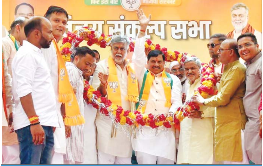
भगवान के अस्तित्व को नकारने वाली कांग्रेस को नहीं है

"आप का एक वोट सुदर्शन चक्र के समान इस चुनाव में करेगा कांग्रेस का विनाश"