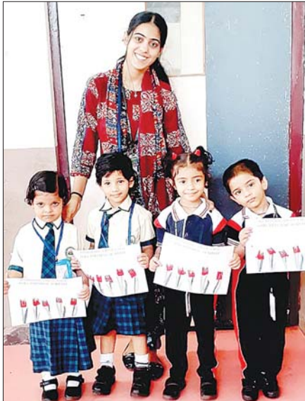
कटनी/ब्यूरो। गत दिवस दिल्ली पब्लिक स्कूल में