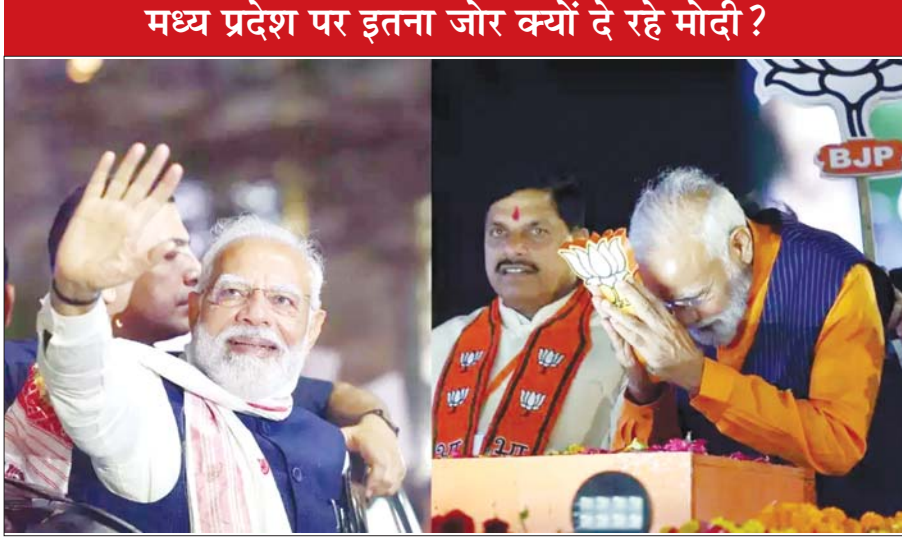
मध्य प्रदेश पर इतना जोर क्यों दे रहे मोदी?

तीन लोकसभा चुनाव और एक विधानसभा चुनाव को मिला लिया जाए तो प्रधानमंत्री नरेंद्र मोदी लगातार चौथी बार सागर की धरती पर प्रचार करते दिखेंगे। वे 2014, 2019 के लोकसभा चुनाव, 2023 के विधानसभा चुनाव में यहां सभा कर चुके हैं। अब 2024 के इस चुनाव में 24 अप्रैल को जनसभा करेंगे। भाजपा ने यहां से महिला प्रत्याशी डॉ. लता वानखेड़े को टिकट दिया है, वे पहली बार